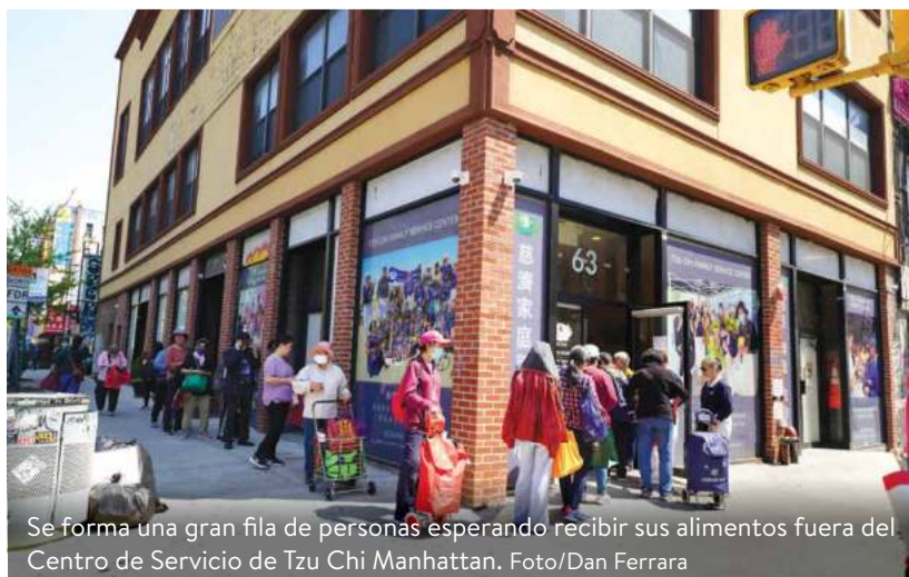
Se forma una gran fila de personas esperando recibir sus alimentos fuera del Centro de Servicio de Tzu Chi Manhattan.

Uno de los programas más destacados de la oficina de Tzu Chi del noroeste es su programa de distribución de alimentos vegetarianos. La oficina de Flushing, Nueva York, cuenta con una co-