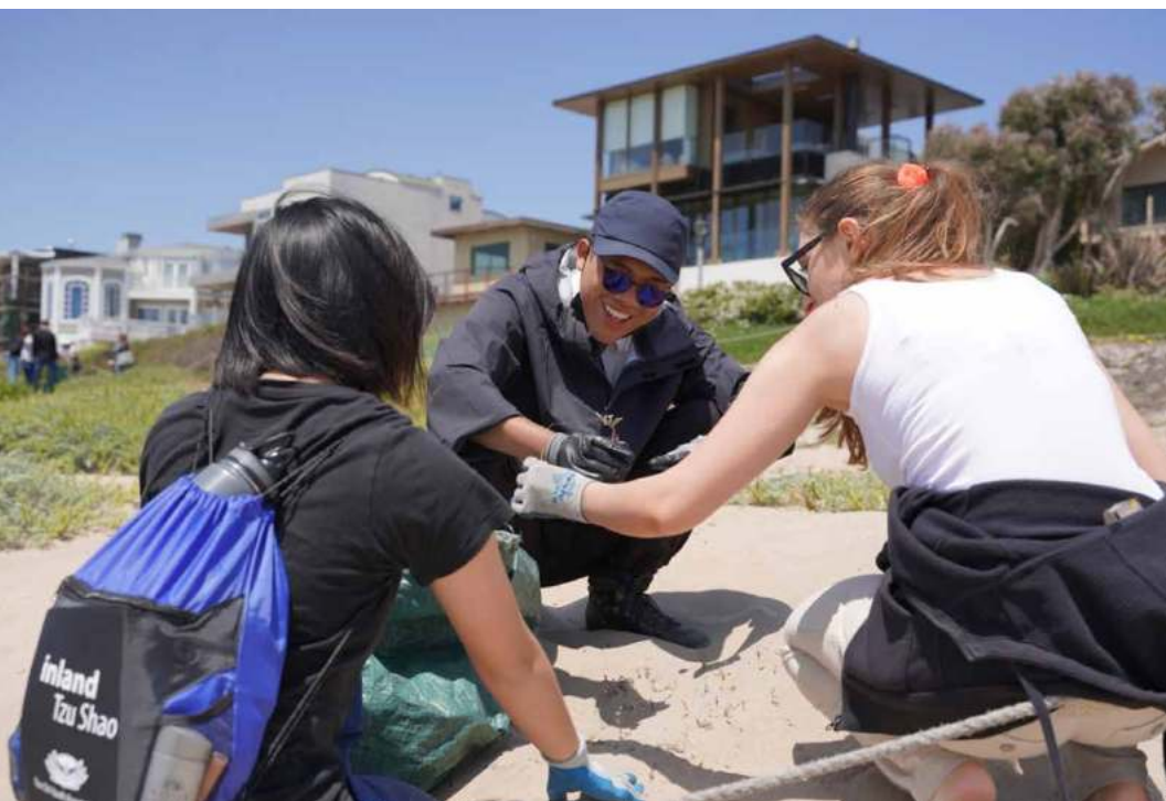
Voluntarios de la IYC practican los ODS de la ONU en Tzu Chi USA, San Dimas, a través de jardinería comunitaria y elaboración de kits de higiene.

asistentes aprendieron sobre los ODS de la ONU y los pusieron en práctica en la Oficina Nacional de Tzu Chi USA en San Dimas, CA. Este enfoque práctico continuó con actividades como la jardinería comunitaria y la elaboración de kits de higiene.