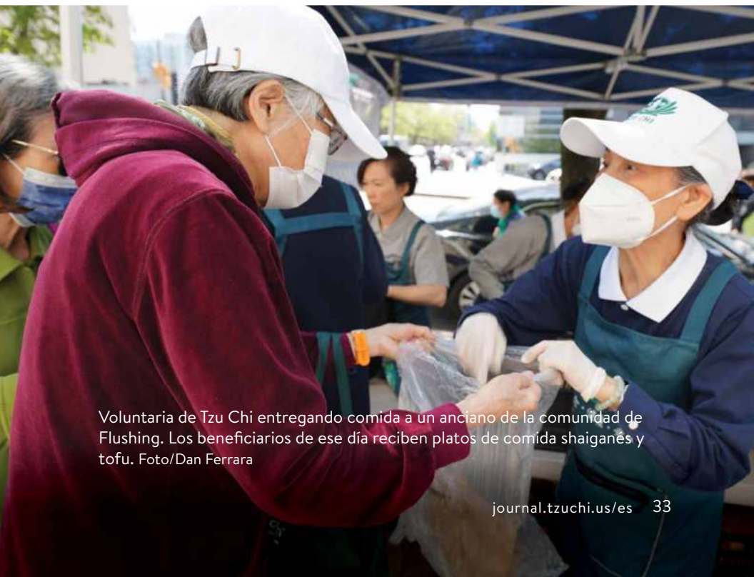
Voluntaria de Tzu Chi entregando comida a un anciano de la comunidad de Flushing. Los beneficiarios de ese día reciben platos de comida shaiganés y tofu.