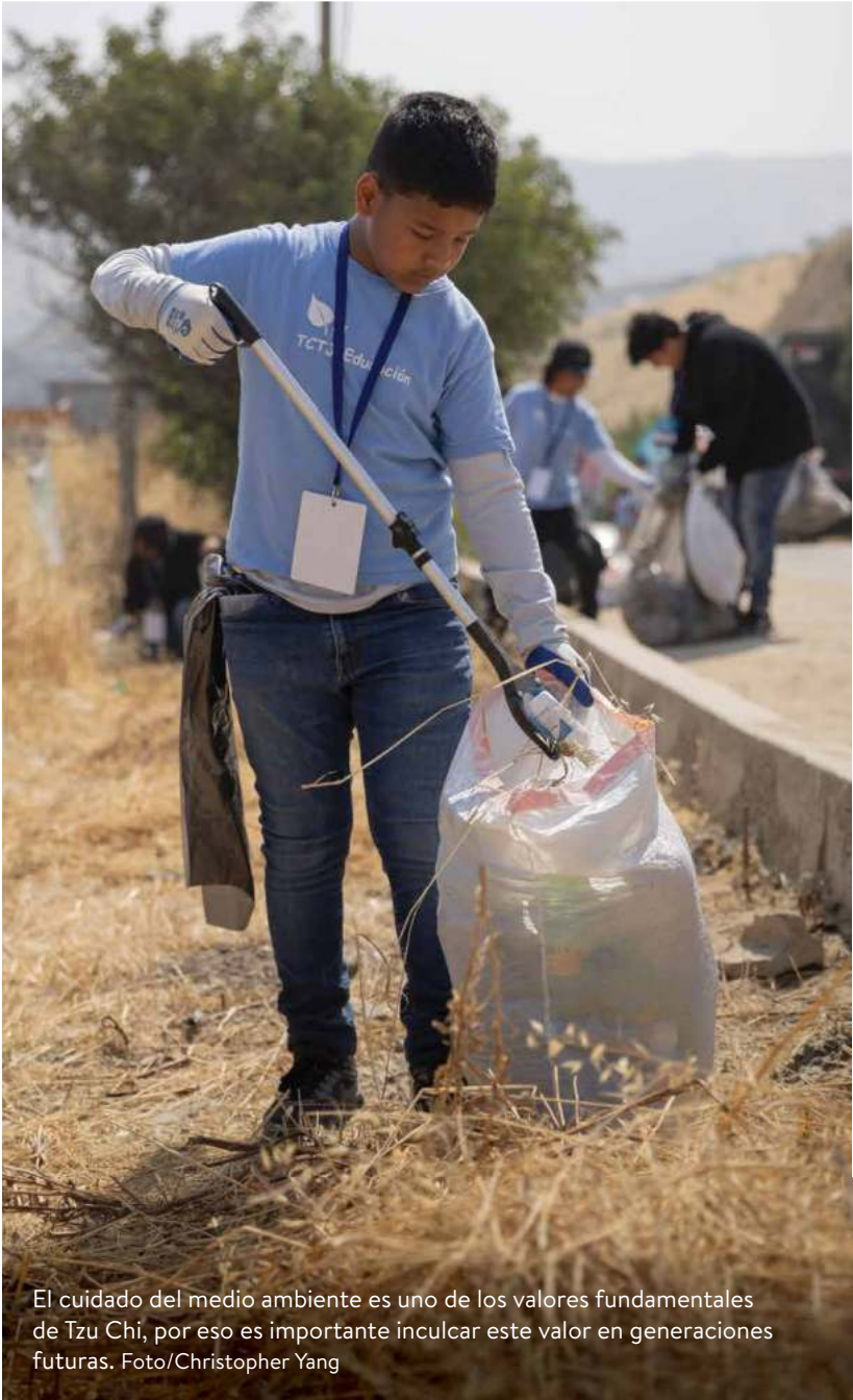
El cuidado del medio ambiente es uno de los valores fundamentales de Tzu Chi, por eso es importante inculcar este valor en generaciones futuras.