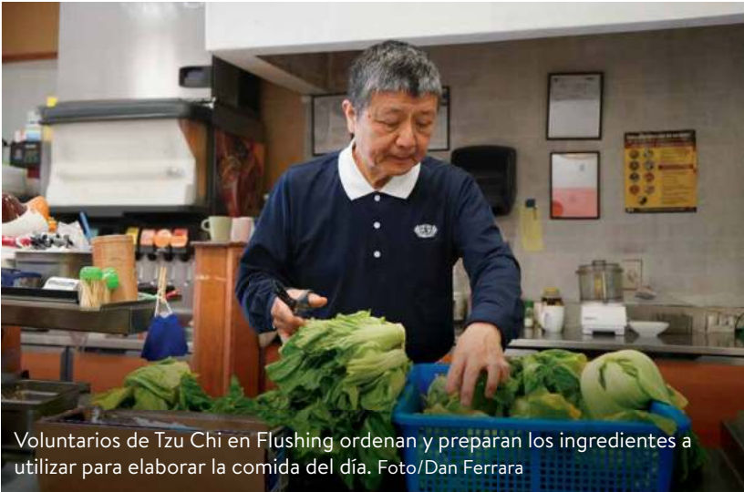
Voluntarios de Tzu Chi en Flushing ordenan y preparan los ingredientes a utilizar para elaborar la comida del día.

un sustento para muchos,” dice John Hong. Los ancianos, algunos de más de 90 años, esperan ansiosos estas entregas, que ofrecen tanto nutrición como compañía. Las inscripciones para recibir la comida son desde las 10:30 a. m. y los beneficiarios pueden llegar a recogerla entre 11:30 a. m. y 12:30 p. m. Los ancianos disfrutan mucho de la comida que los voluntarios les preparan con mucho amor, es por eso que cada semana más de 100 personas llegan a recibir su parte.