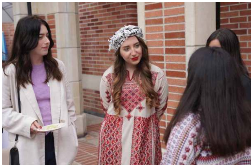
Más de 400 representantes de diversos países llegan a Los Ángeles para participar personalmente en el ‘Noveno Congreso Internacional de la Juventud’.

Tras días de aprendizaje, intercambio y colaboración de ideas, la novena edición de la IYC empoderó a los jóvenes con los recursos y habilidades necesarios para ser contribuyentes proactivos a soluciones globales. “Estamos involucrando a los jóvenes. Pueden equiparse mejor con las habilidades para servir a la humanidad. Y Tzu Chi es una organización y una fundación que nos ayuda a lograrlo,” concluyó Mustafa. La conferencia sigue siendo una inspiración para muchos jóvenes, reforzando el compromiso de la juventud con un futuro sostenible y pacífico, en colaboración con organizaciones como Tzu Chi, creando un mundo mejor con una nueva generación de agentes de cambio. 🌱