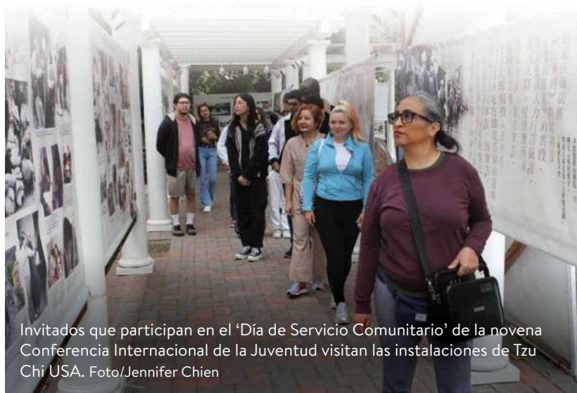
Invitados que participan en el ‘Día de Servicio Comunitario’ de la novena Conferencia Internacional de la Juventud visitan las instalaciones de Tzu Chi USA.

El impacto de estas actividades fue tangible en la restauración costera en Manhattan Beach, donde los delegados trabaja-