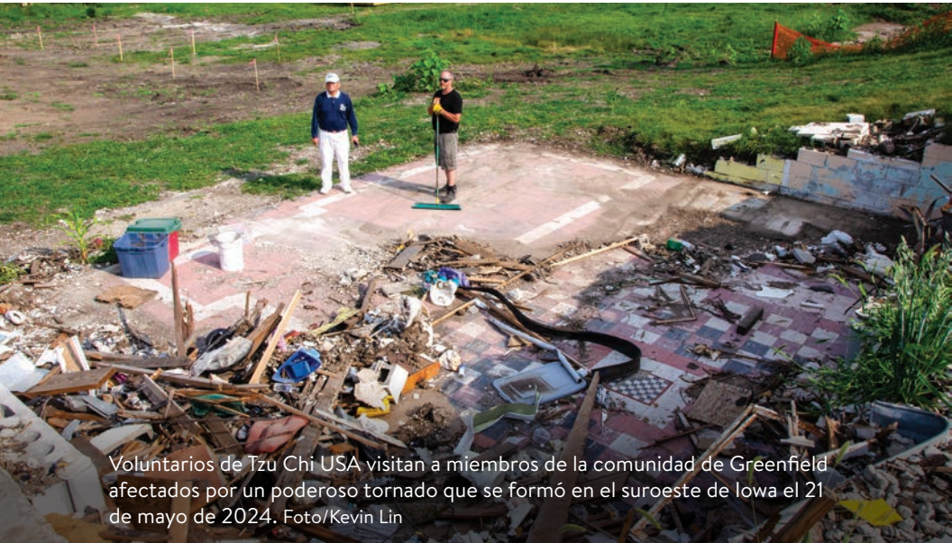
Voluntarios de Tzu Chi USA visitan a miembros de la comunidad de Greenfield afectados por un poderoso tornado que se formó en el suroeste de Iowa el 21 de mayo de 2024.

Entre el 19 y el 27 de mayo de 2024, el Medio Oeste de EE. UU. fue golpeado por tormentas devastadoras. Hasta el 28 de mayo, el Servicio Meteorológico Nacional había confirmado 875 tornados. Uno de los eventos más destructivos fue un poderoso tornado que se formó en el suroeste de Iowa el 21 de mayo y recorrió casi 44 millas dejando destrucción y arrasando la ciudad de Greenfield, Iowa.