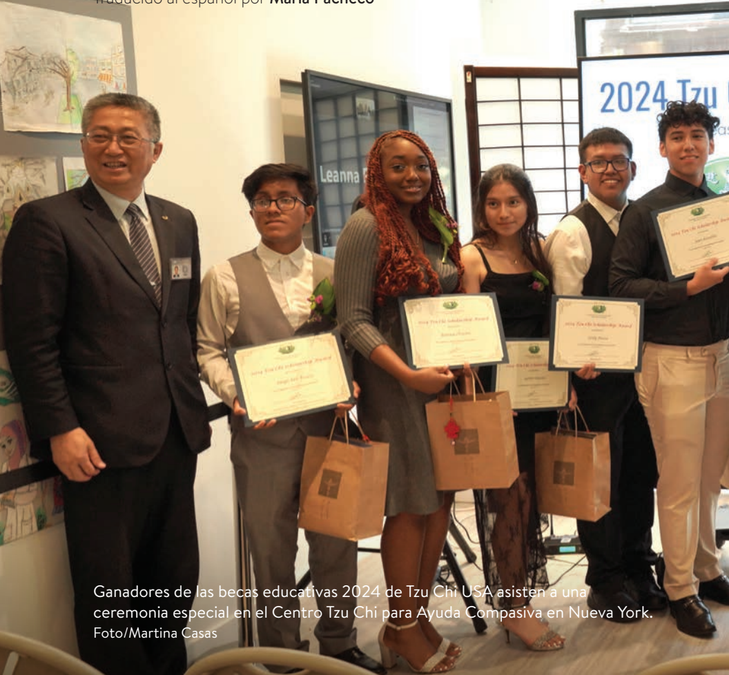
Ganadores de las becas educativas 2024 de Tzu Chi USA asisten a una ceremonia especial en el Centro Tzu Chi para Ayuda Compasiva en Nueva York.