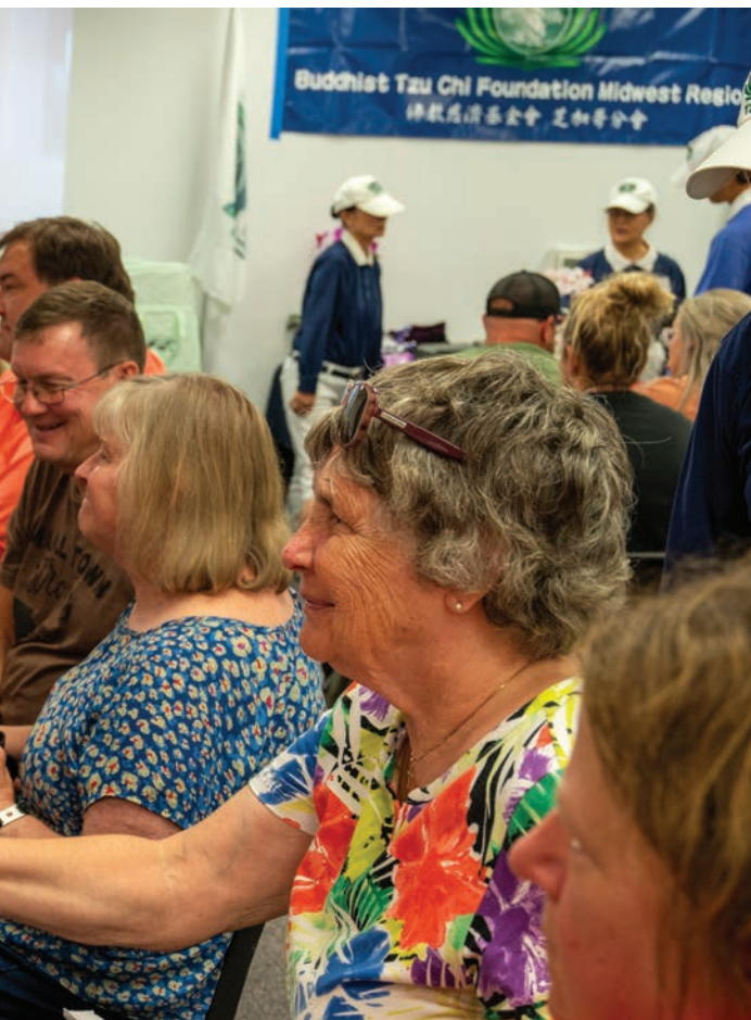
Vuelven las sonrisas mientras comienza la ayuda humanitaria de Tzu Chi.