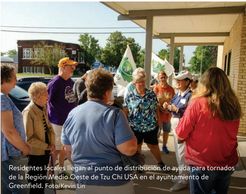
Residentes locales llegan al punto de distribución de ayuda para tornados de la Región Medio Oeste de Tzu Chi USA en el ayuntamiento de Greenfield.

El 28 de julio de 2024, un equipo de 24 voluntarios de Tzu Chi de Chicago viajó a Greenfield, Iowa, para llevar a cabo esfuerzos cruciales de ayuda.