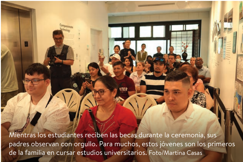
Mientras los estudiantes reciben las becas durante la ceremonia, sus padres observan con orgullo. Para muchos, estos jóvenes son los primeros de la familia en cursar estudios universitarios.

La falta de educación superior también afecta al empleo. Los datos de la BLS indican que en febrero de 2022, la tasa de desempleo para las personas de 25 años fue de 4.5%, mientras que la tasa para aquellos con un título de licenciatura o superior fue de 2.2%.